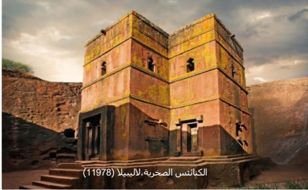
الكنائس الصخرية، لالبيلا (11978)