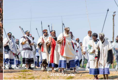
نظام جادا 2016