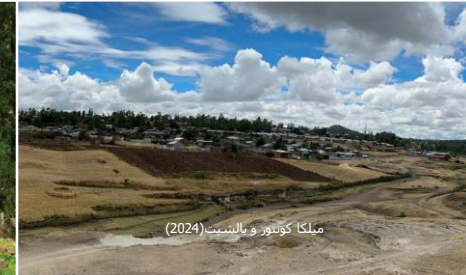
ميلكا كونتور وبيتنت (2024)