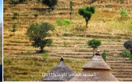
المشهد الثقافي لكونسو (2011)