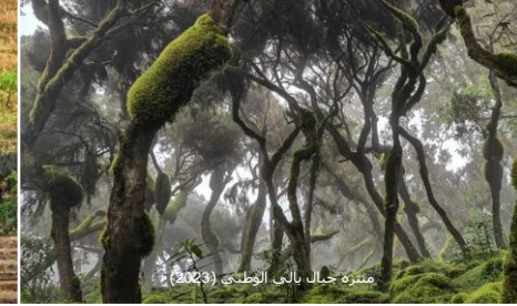
منتزه جبال بالي الوطني (2023)