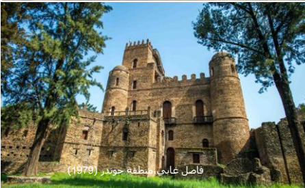
فاصل غابي، منطقة غوندر (1979)