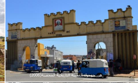
هجر جوجول، المدينة التاريخية المحصنة (2006)