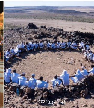
قانون يسوع 2024