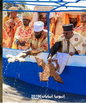
إثيوبيا إيمانان 2019