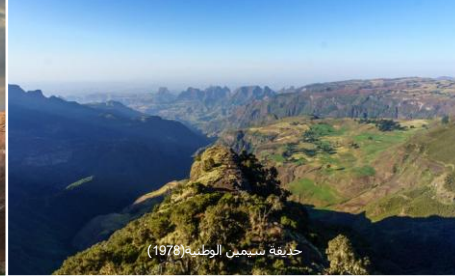
حديقة سيمين الوطنية (1978)