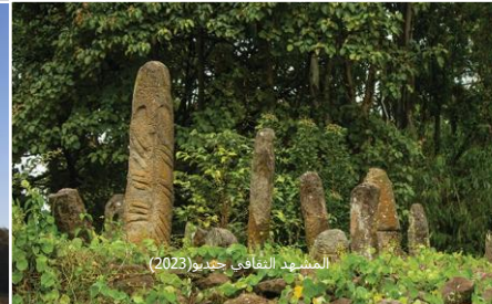
المشهد الثقافي جديو (2023)