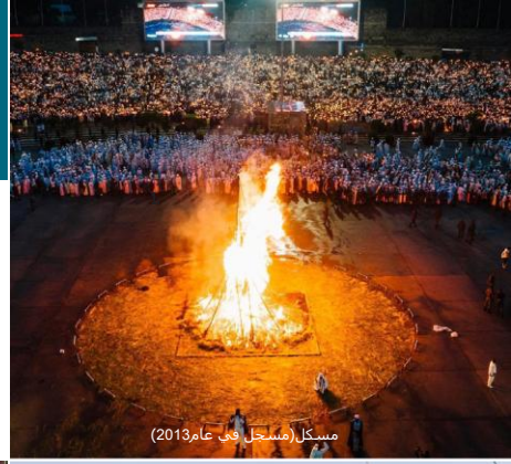
مسكل (مسجل في عام 2013)