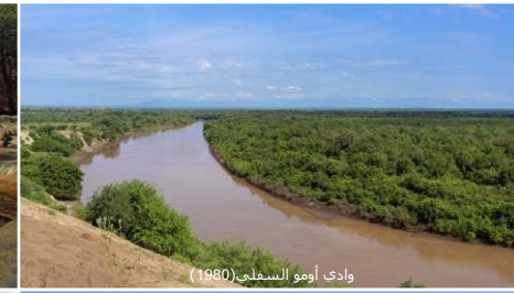
وادي أومو السفلي (1980)