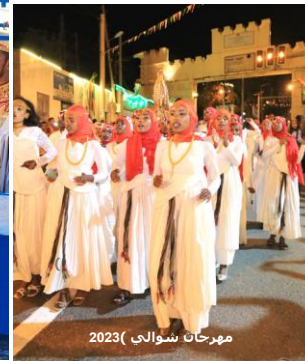
مهرجان شواليد 2023